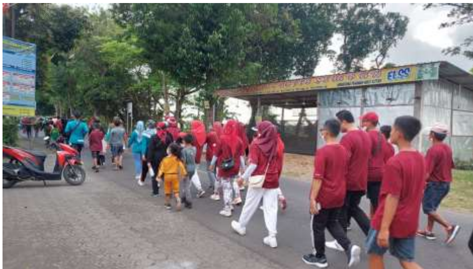
18. Pembagian Kursi Inventaris