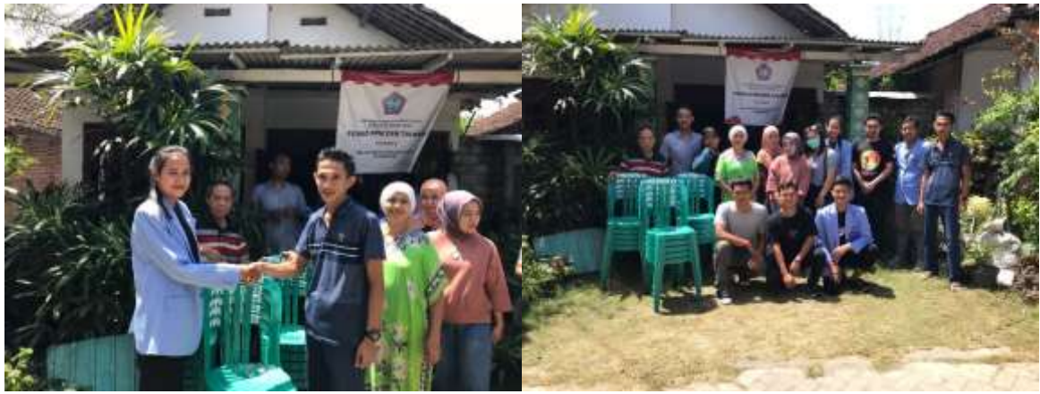
19. Penutupan PPM