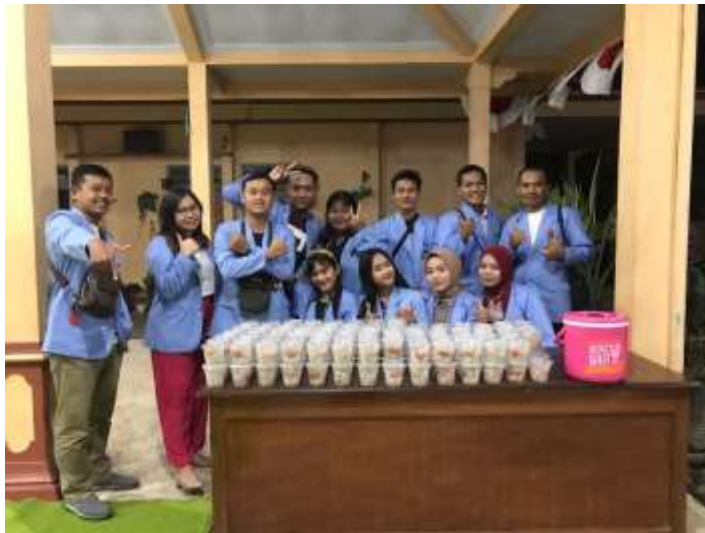
12. Jalan Sehat Warga Dusun Talapan (21 Agustus 2022)