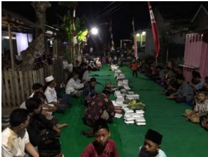
10. Rapat Program Pemerintah Desa dalam rangka memeriahkan HUT RI ke-77 (18 Agustus 2022)