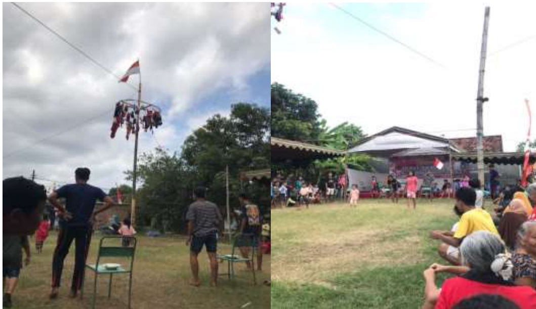
14. Pelantikan Kepala Dusun Talapan (21 Agustus 2022)