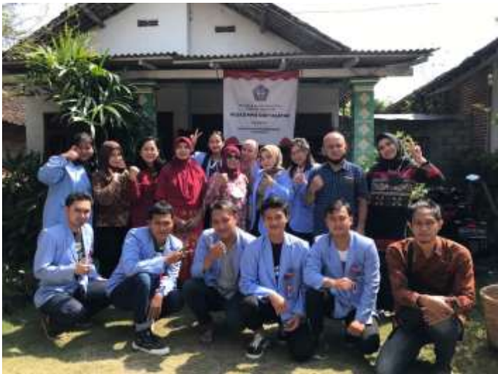
16. Sosialisasi Hukum kepada Warga (26 Agustus 2022)