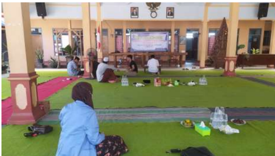
9. Malam tirakatan 17 Agustus (16 Agustus 2022)