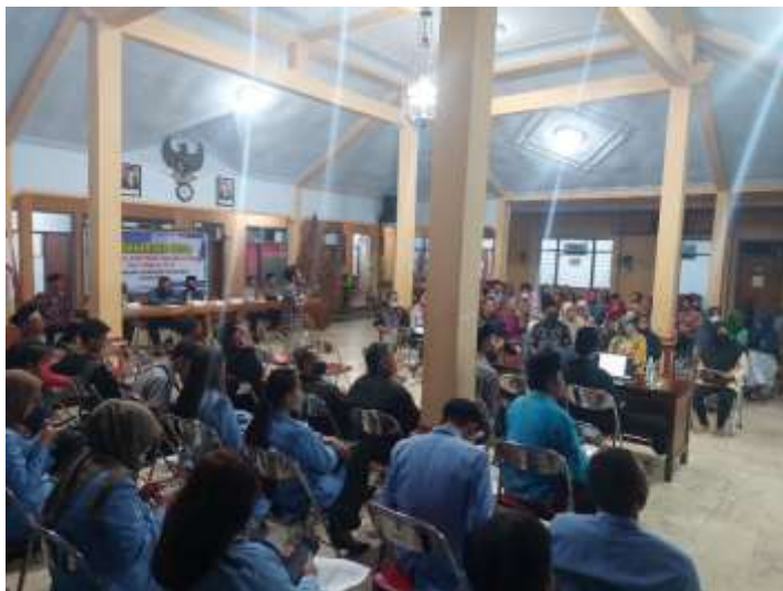
11. Pengaduan Warung Gratis (20 Agustus 2022)